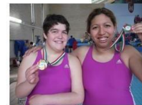
Premiazione ai Campionati Italiani Promozionali 2013- Ascoli Piceno