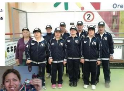
La nostra squadra di bocce